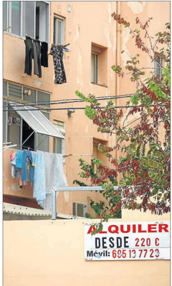
Una inmobiliaria con decenas de ofertas en su escaparate y dos de los inmuebles en Alicante, en los que se alquilan pisos. JOSE NAVARRO

zando a subir un poquito. Así, en la zona de Maristas apenas hay ya cosas por 600 euros y hay quienes vuelven a pedir 650». Los barrios más caros de la ciudad siguen siendo el Cabo Huertas, Condomina y campo de Golf, primera línea de mar y algunas calles del Centro y del Ensanche con medias entre 650 y 700 euros mensuales. Por contra, según Rosa Julia, «hay zonas de Alicante en que los precios han caído por los suelos y se puede encontrar un piso de 2 o 3